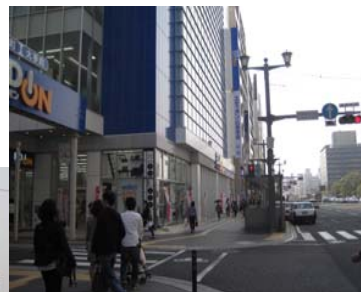
② この交差点（エディオン本館と新館の間）を左折