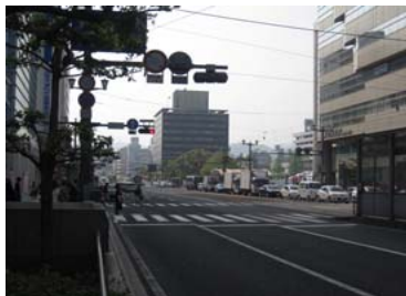
① 紙屋町西電停交差点手前