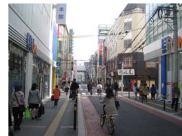
③ 一方通行の道を南へ（狭いので気をつけてください）