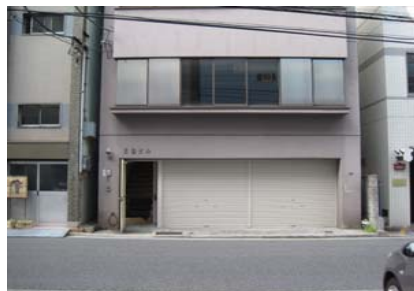
すまいるスタジオ前景 当日はシャッターが開いています